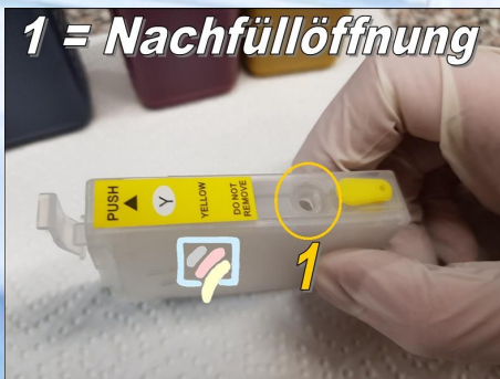
1 = Nachfüllöffnung