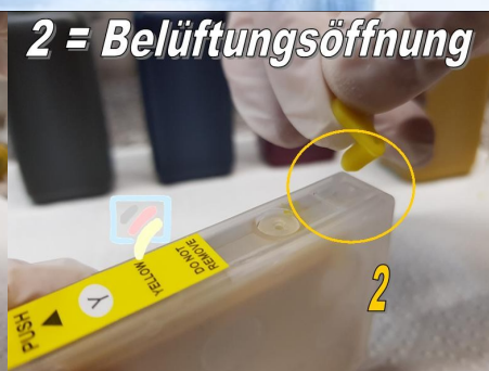
2 = Belüftungsöffnung

Jetzt wird der Belüftungsgummi rausgezogen damit die Patrone „Atmen“ kann.