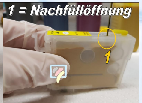
1 = Nachfüllöffnung

Dr. Inkjet Easyrefillpatronen verfügen über 2 Öffnungen. Die eine ist für das auffüllen gemacht und die andere erheblich kleinere Öffnung ist für die Belüftung der Patrone zuständig.