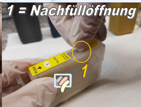
1 = Nachfüllöffnung